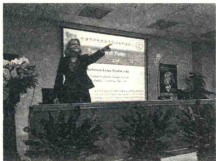
瑞贝卡在北京师范大学作讲座

2014 年 9 月 23 日，在由上海教育报刊总社主办的“美国国家年度教师中国行”活动中，瑞贝卡也应邀来到中国。有不少观众询问瑞贝卡的卓越之道，她说：“我有非常坚定的教育学生的热情，我对学生的未来是没有底限地绝对相信，我对于我自己每天做的事情是充满渴望的，我对我学生的未来也都充满希望，并且我有坚定的信念，相信我所教出来的学生有一天一定会改变这个国家和世界。我们现在